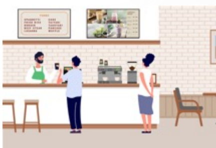
カフェやレストランで